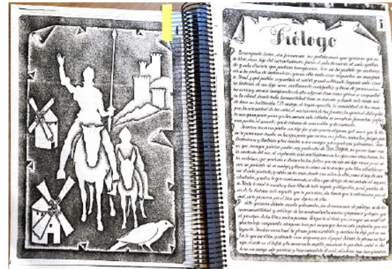
Pie de foto. Ejemplo de ilustración y copia a mano del Quijote.

El 12 de febrero de 2002, su último cumplea-