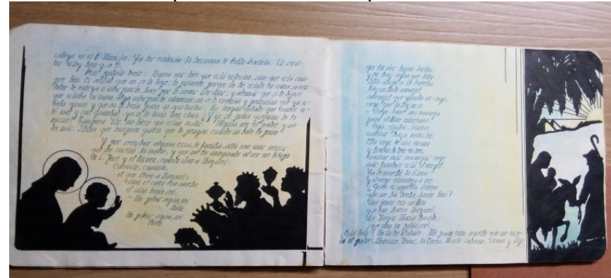
Pie de foto. Felicitación navideña de Gaudencio Ongay, escrita e ilustrada a mano.

No desaprovecha el tiempo. Además de estu-