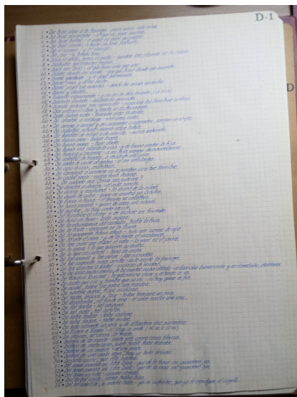
Pie de foto. Ejemplo de hoja de cuaderno con los refranes numerados y manuscritos.