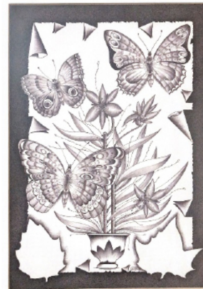
Pie de foto. Dibujo original de Gaudencio Ongay.