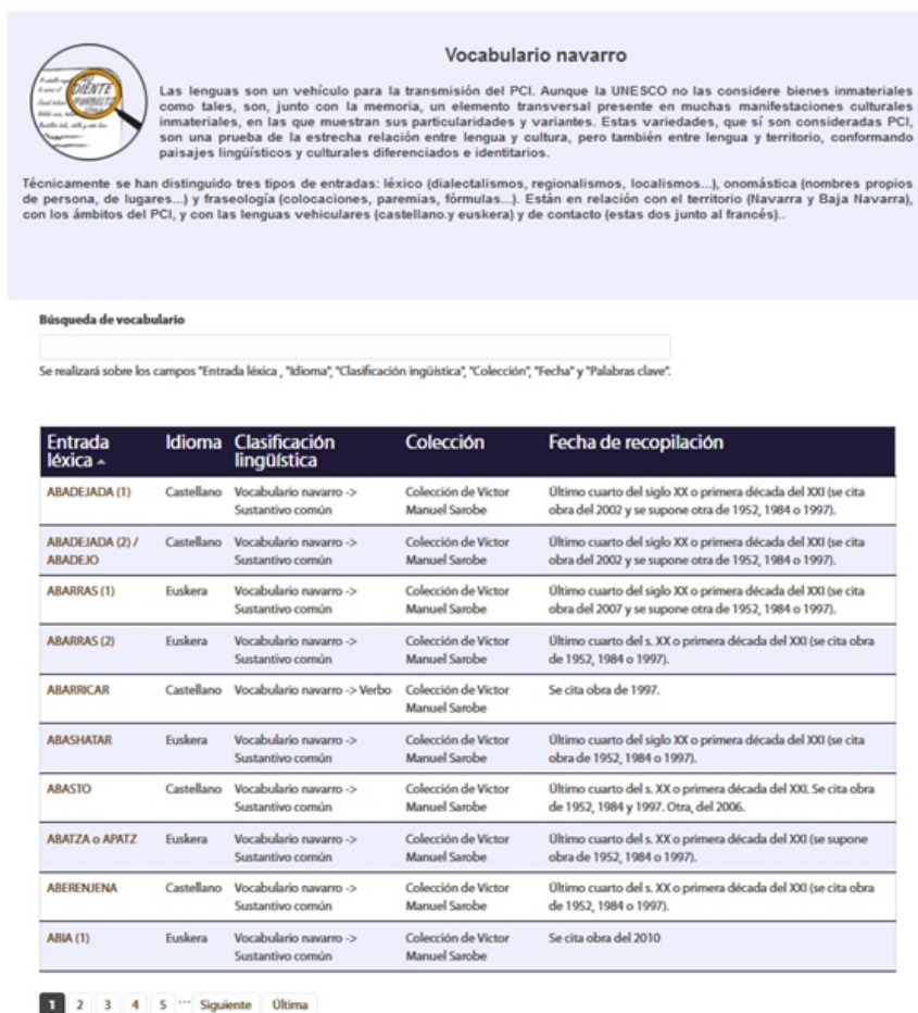
Ilustración 8. Pantalla de inicio de la sección del centro de documentación dedicada al estudio de las particularidades lingüísticas: https://www.navarchivo.com/es/vocabulario-navarro

Técnicamente se han distinguido tres tipos de entradas: léxico (dialectalismos, regionalismos, localismos...), onomástica (nombres propios de persona, de lugares...) y fraseología (colocaciones, paremias, fórmulas...).