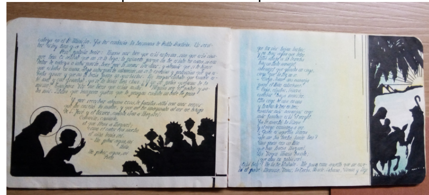
Pie de foto. Felicitación navideña de Gaudencio Ongay, escrita e ilustrada a mano.

No desaprovecha el tiempo. Además de estu-