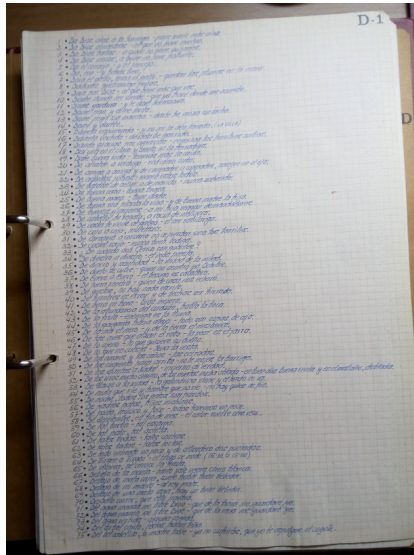
Pie de foto. Ejemplo de hoja de cuaderno con los refranes numerados y manuscritos.