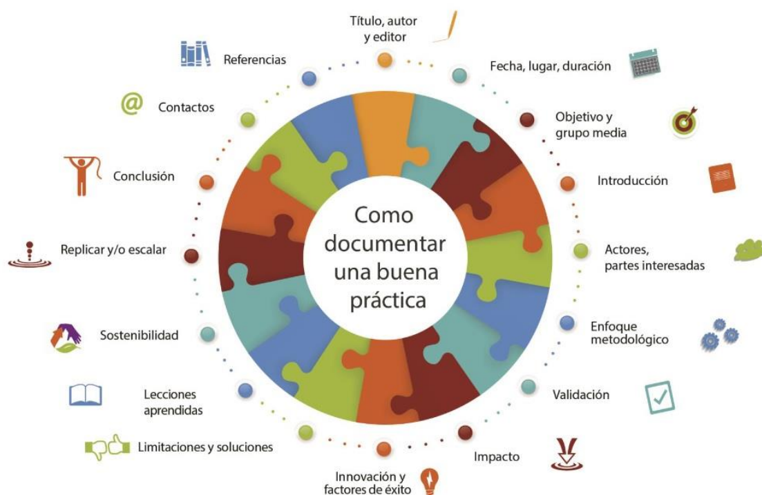
Ilustración 1. Aspectos necesarios en la documentación de una buena práctica.

Sistema para documentar una buena práctica: