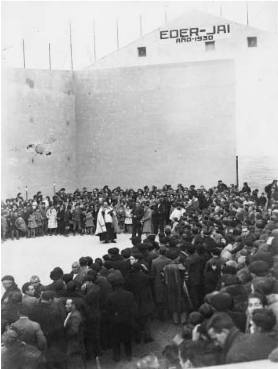
Bendición del frontón Eder-Jai.