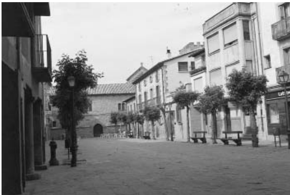
Plaza del Castillo, La Galería.